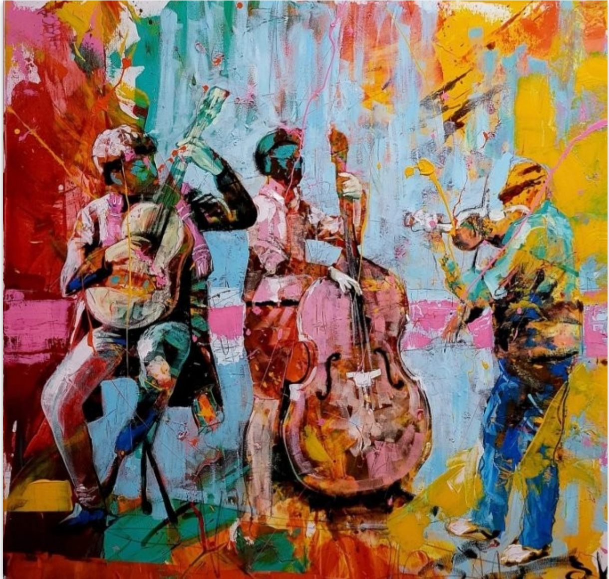
(8. Szabados Norbert 120X100 cm-es Utcazenészek című vászonfestménye.