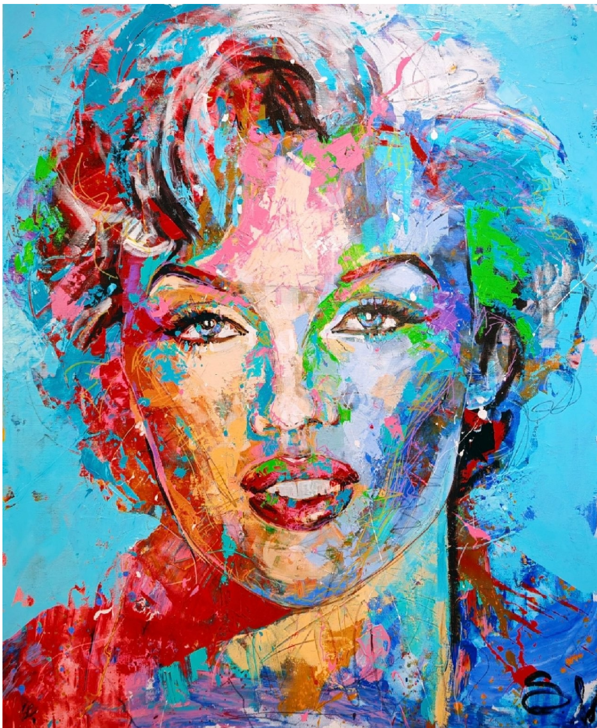
(7. A festő egyik legkedvesebb témájáról Marilyn Monroe-ról készült vászonfestmény.)