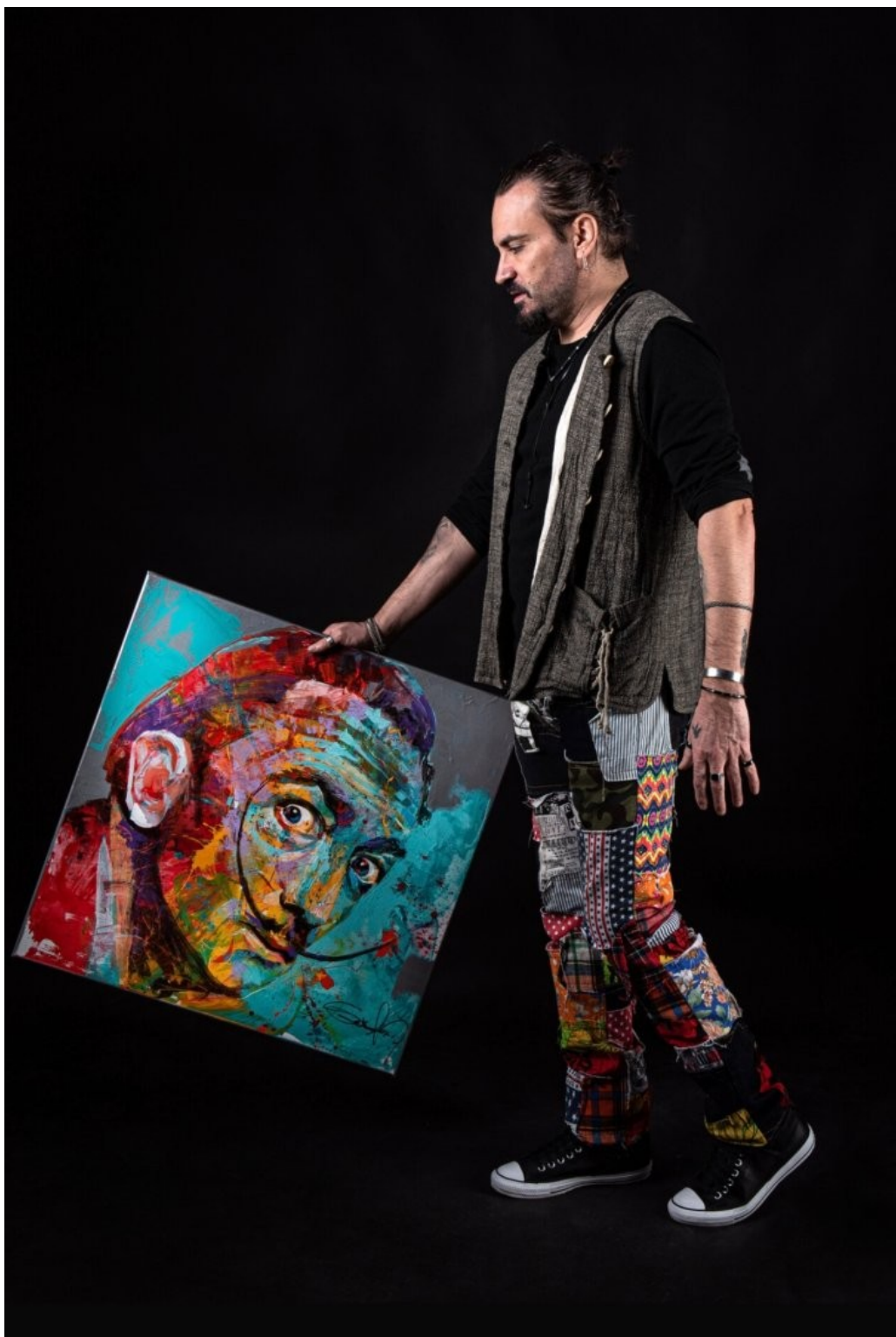
(11. Szabados Norbert egyik legkedvesebb alkotásával, a Salvador Daliról készült festményével.